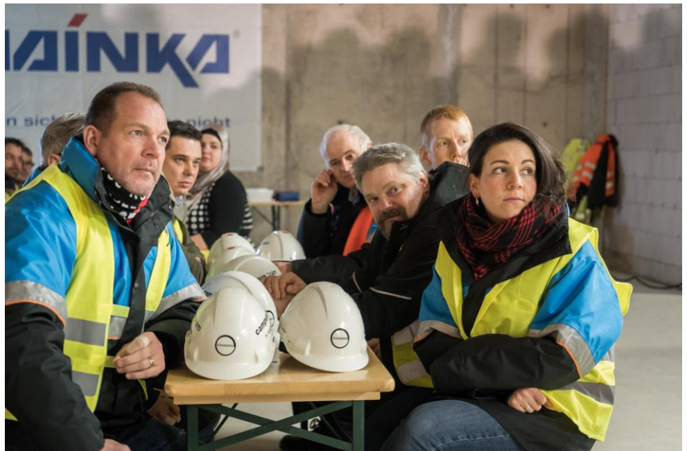
Das Team freut sich, das der Rohbau termingerecht fertig ist.