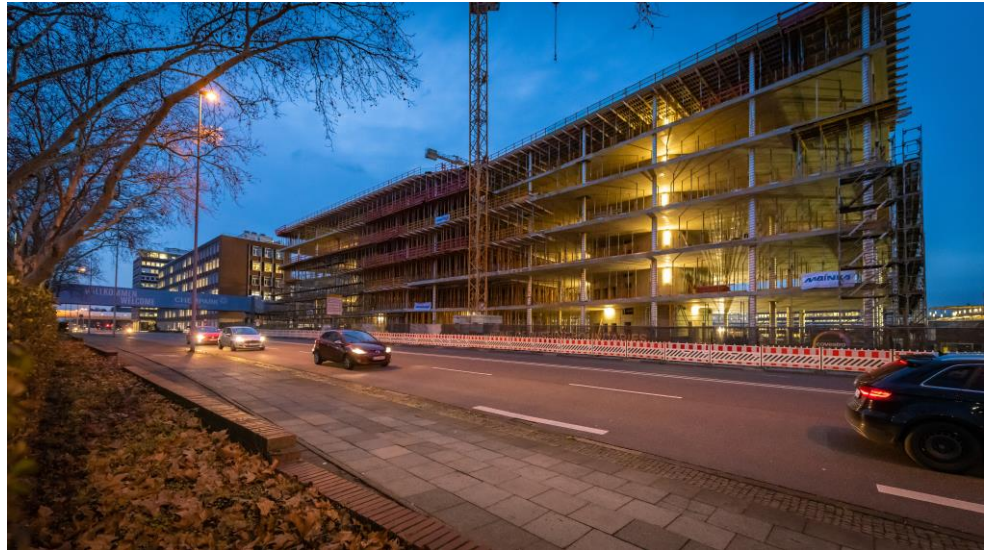
Der Rohbau ist fertig: das Gebäude von Covestro an der Bundesstrasse 8.